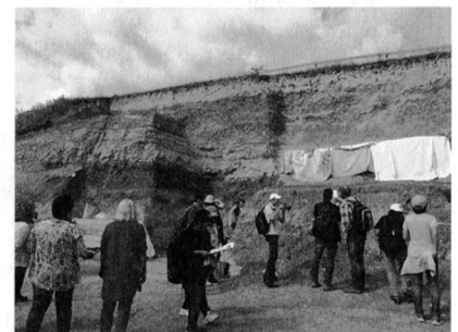
写真5 シェスタコヴォ3のIlek層発掘現場の露頭。