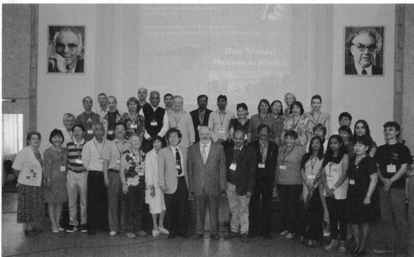
写真1 Trofimuk石油地質・地球物理学研究所の会議場での記念撮影。

閉会セッションでは、5回目となる2017年のシンポジウムは韓国済州島で、大韓地質学会70周年行事と重ねて、10月25-27日に行わ